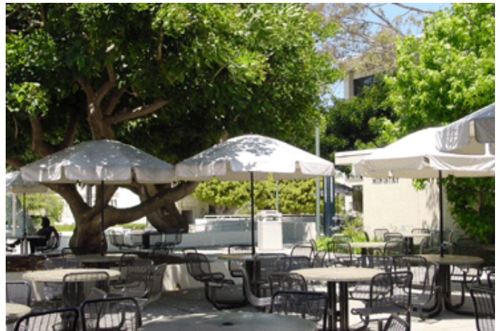
Terraza del comedor